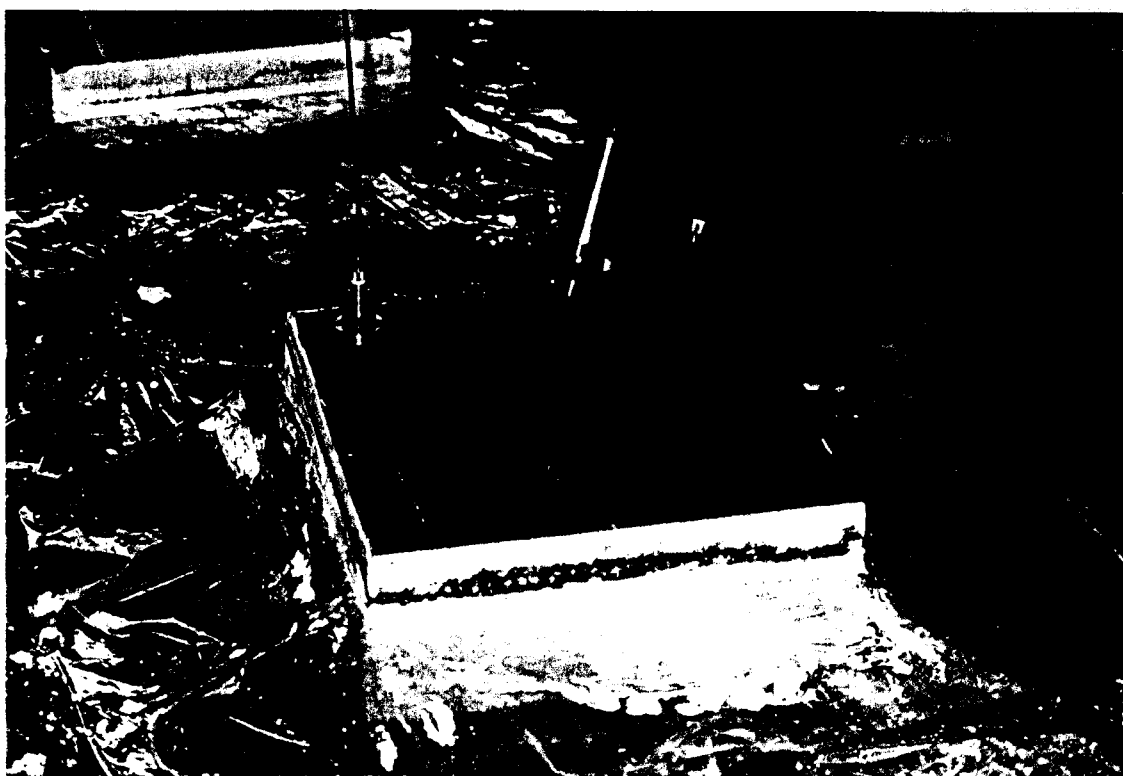
Fig. 1 - Dispositivo di prova.